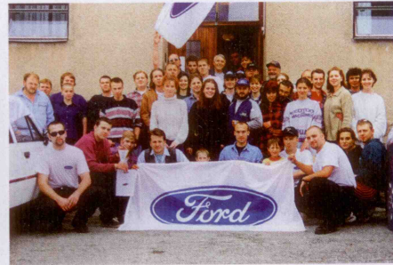
Jak šel čas anebo co bylo a už nikdy nebude. „Fousaté“ fotografie se srazů příznivců značky Ford z let 1997, 1998 a 1999 (zleva).